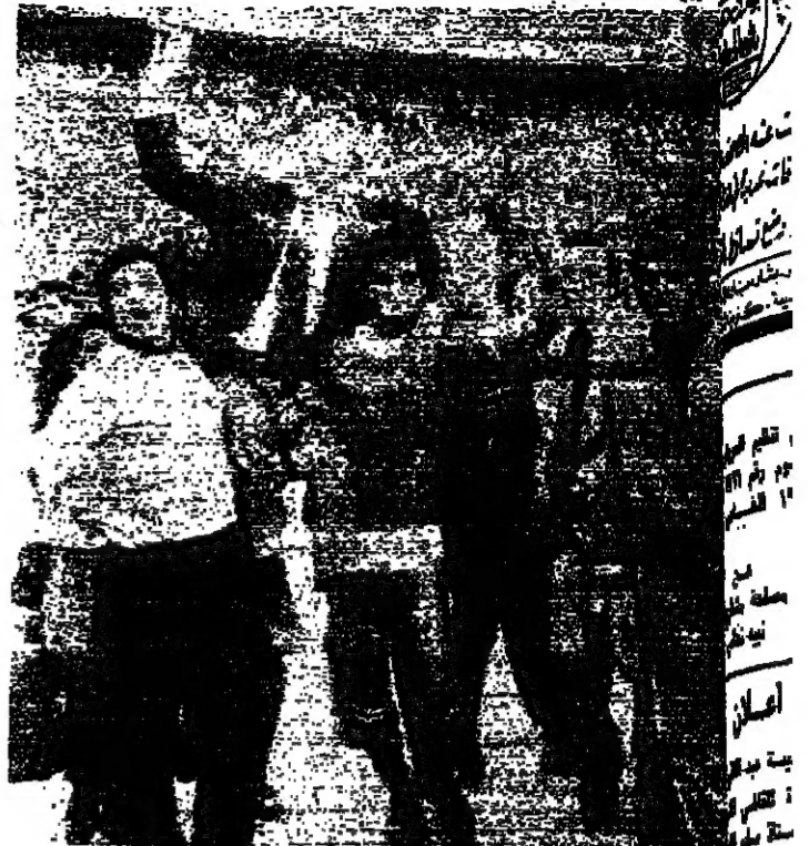
اللاعبون الذين سيواجهون الاهلي في مباراة ايلول ببيروت